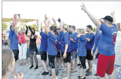
1. Seeteufel (Emder Kanu-Club) 01:14,06