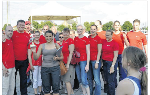
2. LzO-Drachenhunter (Landessparkasse zu Oldenburg) 01:17,99