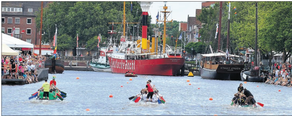
Jedes Jahr ein toller Anblick: Die Drachenboote in voller Fahrt zwischen den von Menschen gesäumten Ufern des Ratsdelft.

Vor allem die Fregatten-Besatzung heizten mit ihrem Schlachtruf „Emden - voran“, zu dem die Seelords immer wieder auch nichtmilitärisches Publikum einbezogen, ordent-