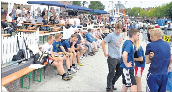
Plauder-Basis am Rande der Regatta-Strecke: Viele jugendliche Rudersportler sorgten am Sonntag im Alten Binnenhafen für Regatta-Flair.

Wie bereits am Sonnabend beim Drachenboot-Rennen, gab es auch bei den Ruderregatten eine Rekordbeteiligung.