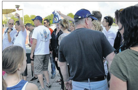
3. Die Stahlharten 01:14,46