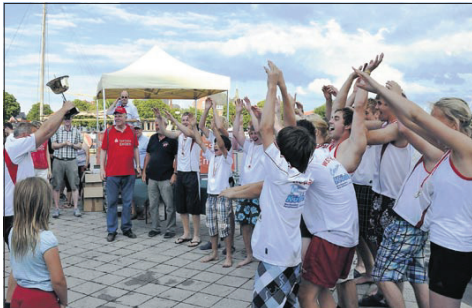
1. Ollsieler Düvels (Altfunnixiel/Carolinensiel) 01:06,96