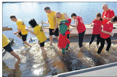
„Hilfe, wir sinken“: Schnell entschlossene Flucht-Sprünge der „City-Dragons“ verhinderten ein Mannschafts-Ganzbad zur Bootstaufe.