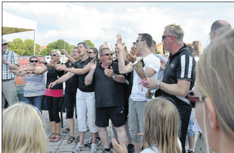
3. Sea Warriors (Wilhelmshaven) 01:12,85