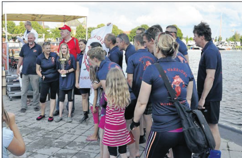
2. Fehntjer Dragons (Rhauderfehn) 01:11,63