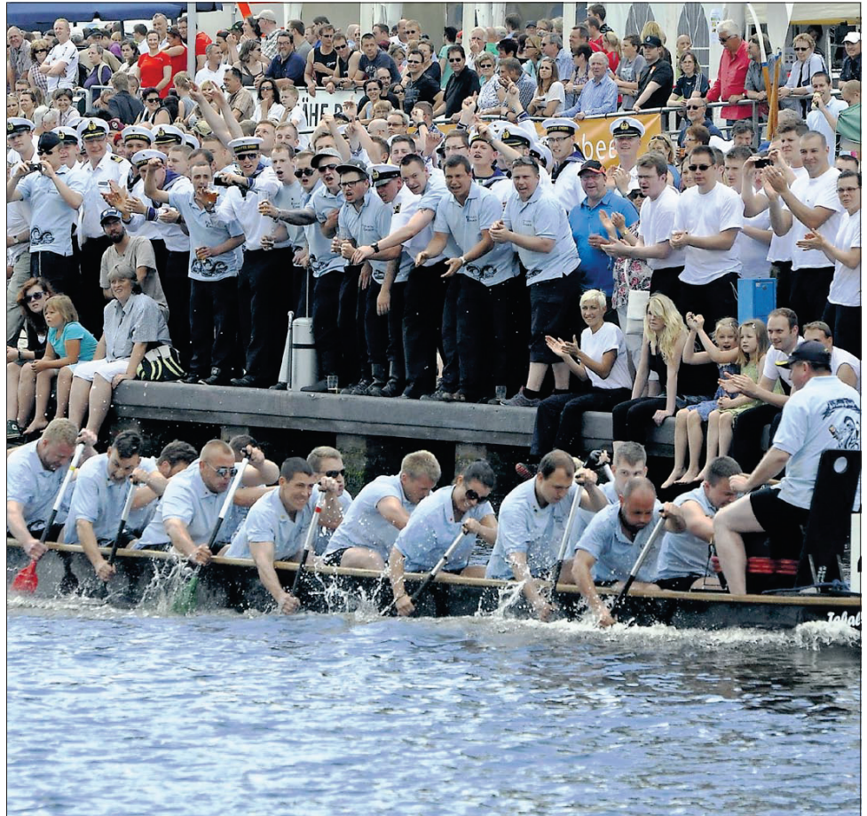
Der Besuch der Fregatte „Emden“ in der Patenstadt zur „Emder Hafenmeile und die Teilnahme

Häuser wurden innerhalb weniger Minuten überflutet: Bei einer Überschwemmung in der Schwarzmeer-Region kamen über 170 Menschen ums Leben. S. 21