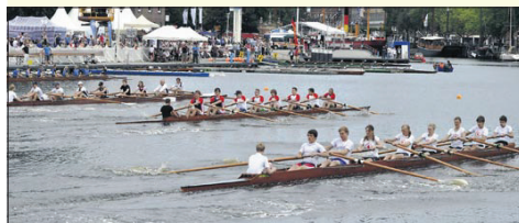
Lauf 4 von 5 im Hans Heinrich-Schulte Cup: In der Mitte der Achter des Emdener Rudervereins.

Emder Ruderverein 01:11,35 Bremer Sport-Club 01:12,89 Ruderverein Leer 01:18,94