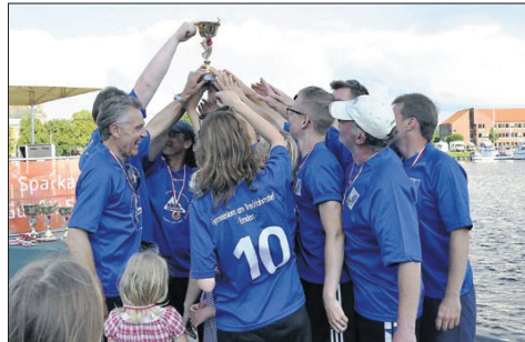
2. GaT-Lehrer 01:14,22