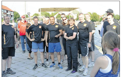
3. Orange Dragons Emdrer Zeitung 01:18,82