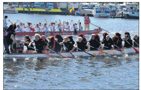
Die Wybelndrachen waren nicht die schnellsten, hatten aber das schönste Kostüm, fand die Jury.