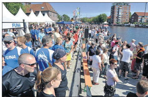
Noch dichter als in den letzten Jahren war das Delftufer belagert während der Drachenboot-Rennen am Sonnabend.

Beste Stimmung „Der Eisener Drache“ Fregatte Emden