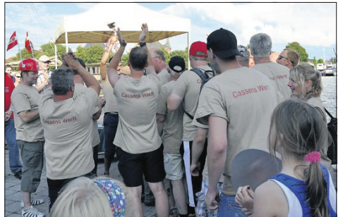
1. Cassens Werft 01:17,82