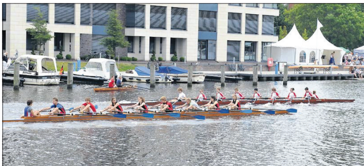
Ein Anblick, der Fans des Rudersports begeistert: Achter mit jungen Ruderern ziehen ihre Bahnen durch den Alten Binnenhafen.